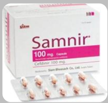
100 mg capsule

รูปแบบยา Cefdinir ที่มีในโรงพยาบาลหนองคาย