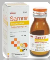
125mg/5 mL suspension